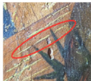
Nimbe et couronne