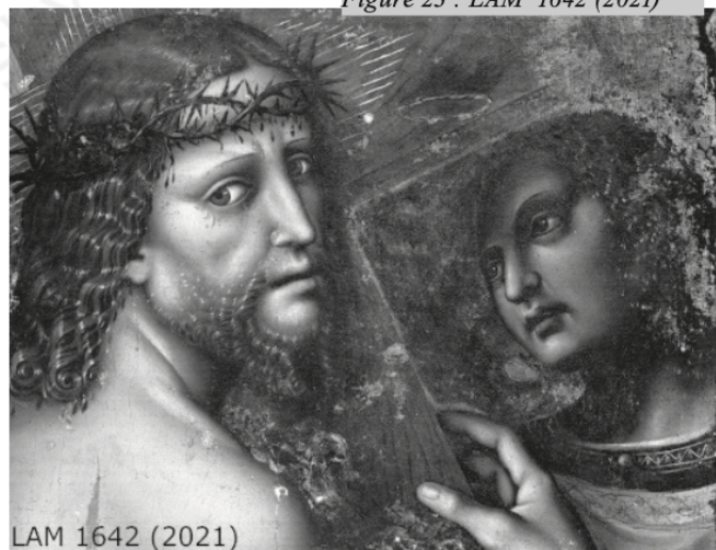
LAM 1642 (2021)

Dès lors, la représentation de cet instant tragique semble éclipsée par la mise en scène de deux protagonistes, le Christ, à l'origine non nimbé, et un 'adorateur'.