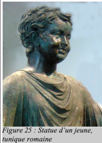
Figure 25 : Statue d'un jeune, tunique romaine